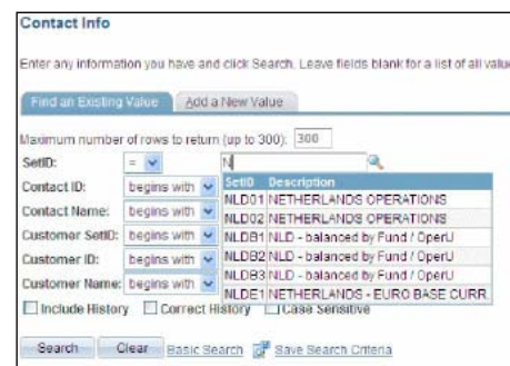
Direct zichtbare zoekresultaten.