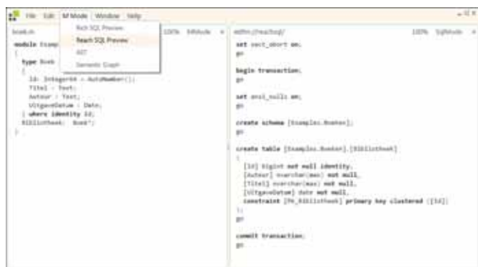
FIGUUR 1: HET MSCHEMA VOOR BOEK IN SQL-PREVIEWMODUS

MGraph is een taal die gebruikt kan worden om data te beschrijven. Als we de analogie met XML doorvoeren, is dit het schrijven