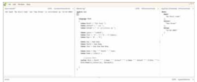
FIGUUR 5: EEN TAAL OM INFORMATIE OVER BOEKEN OP TE SCHRIJVEN

Met MGrammar kun je iedere taal maken, je kunt denken aan je eigen programmeertaal. Maar uit de presentaties die gegeven zijn op de PDC, blijkt dat Microsoft met Oslo programmeurs wil stimuleren om hun eigen domeinspecifieke taal (DSL) te bouwen. Een DSL is een taal die gericht is op een specifiek, klein domein, zoals bijvoorbeeld 'verzekeringen' of 'databases'. In die zin kun je een DSL zien als het tegenovergestelde van een programmeertaal, die juist geschikt is voor ieder domein. Voorbeelden van DSL's zijn SQL en HTML. Een simpele DSL voor het domein 'boeken' zou er bijvoorbeeld zo uit kunnen zien: