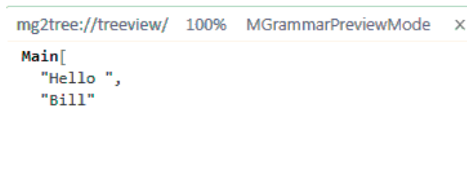
FIGUUR 4: GEPARSTE BOOM BEHORENDE BIJ 'HELLO BILL'

Als met bovenstaande uitgebreidere Hello-taal, de tekst 'Hello Bill' geparst wordt, ziet dat er zo uit: