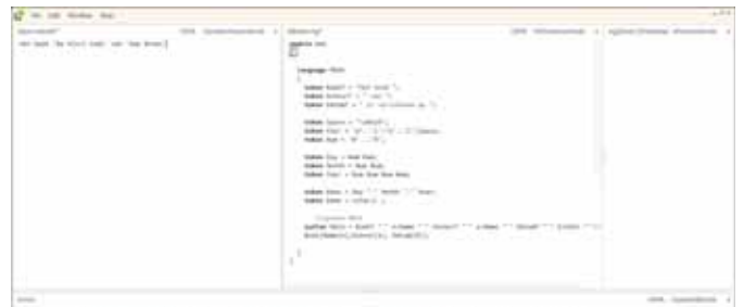
FIGUUR 6: ALS HET PARSEN MISLUKT, TOONT INTELLIPAD FOUTINFORMATIE

Wat gebeurt er wanneer we een bestand proberen te parsen dat niet voldoet aan onze taal? Oslo genereert automatisch foutmeldingen als er wat mis gaat; met beknopte informatie over waarom het parsen niet lukt.