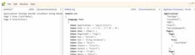
FIGUUR 8: MWEBAPPLICATIE IN INTELLIPAD

Nu gaan we net als hierboven de boom doorlopen. Het gemak van het maken van een runtime is het feit dat het at designtime precies bekend is hoe de boom opgebouwd is. In plaats van de gehele boom recursief te doorlopen, kunnen we nu die informatie uit de boom halen die nodig is om, in dit geval, een webapplicatie te draaien. Op deze manier bijvoorbeeld wordt de Connection-String opgebouwd: