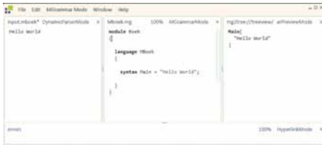
FIGUUR 3: HELLO WORLD IN LIVE-PARSE MODUS. LINKS DE INVOER, IN HET MIDDEN DE BESCHRIJVING VAN DE TAAL, RECHTS DE GEPARSTE DATA

kunnen worden. De regel 'Syntax Main = "Hello World";' geeft aan dat de taal alleen maar mag bestaan uit Hello World.